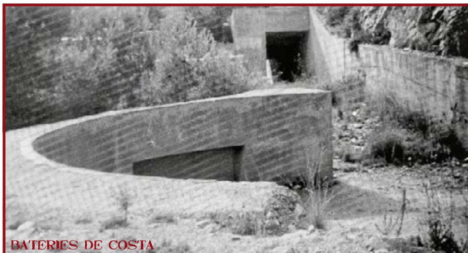
BATERIES DE COSTA

Clica aquí per a llegir un article al respecte del Diari de Tarragona.